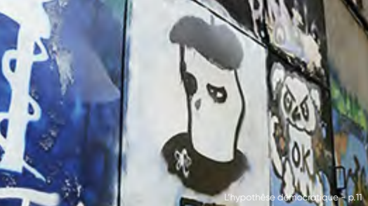
L'hypothèse démocratique - p.11