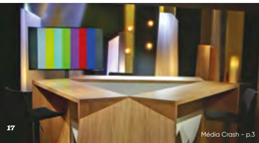
Média Crash - p.3