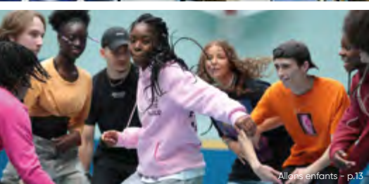
Allons enfants - p.13