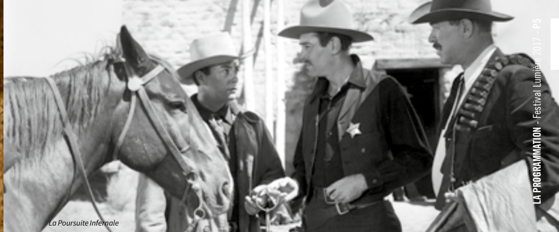
La Poursuite Infernale