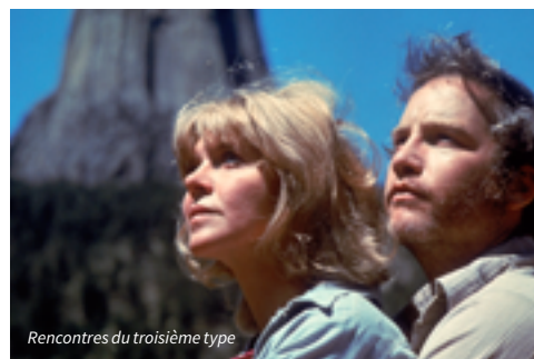
Rencontres du troisième type

À l'occasion du centenaire de sa naissance, hommage en deux films ( Le Doulou et Bob le flambeur , restaurés par Studio Canal) à celui dont l'admiration pour le cinéma noir américain lui fera créer un cinéma à son tour fortement admiré par les réalisateurs outre-Atlantique.