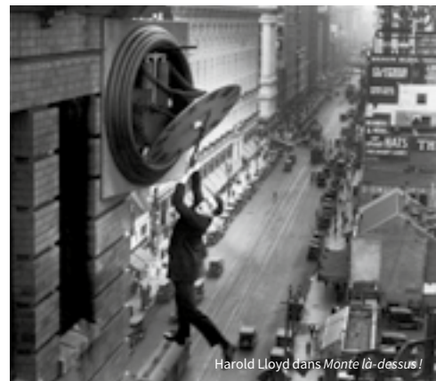
Harold Lloyd dans Monte là-dessus !

Hellboy , Le Labyrinthe de Pan , Pacific Rim , mais aussi le rare Cronos : le réalisateur mexicain est l'un des plus originaux metteurs en scène hollywoodiens de films fantastiques. Il vient à Lyon avec son nouveau film The Shape of Water en avant-première française, ainsi qu'une carte blanche étonnante !