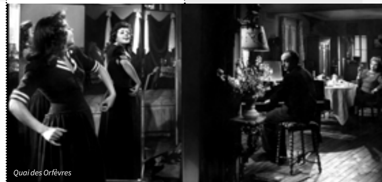
Quai des Orfèvres