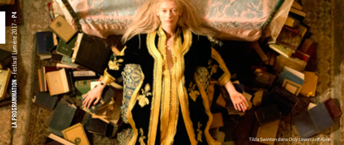
Tilda Swinton dans Only Lovers Left Alive