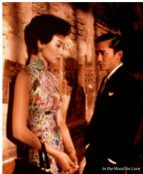
In the Mood for Love