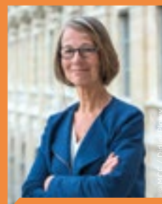
FRANÇOISE NYSSSEN Ministre de la Culture

Chez nos partenaires : Hôtel Kyriad et Le Sphinx Montélimar www.montelimar-tourisme.com