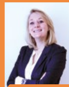
ALICE THOUROT Députée de la Drôme

Je remercie ses membres, ses bénévoles, et je souhaite à toutes et à tous de superbes découvertes, pour cette 6 e édition « De l'écrit à l'écran ».