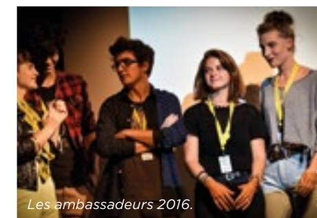
Les ambassadeurs 2016.