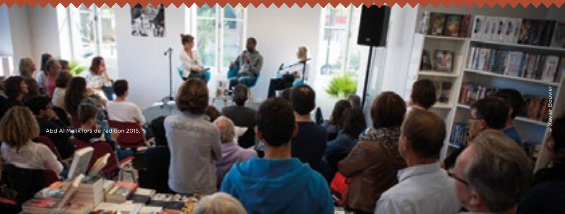
Abd Al Mallik lors de l'édition 2015.